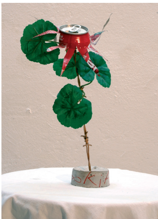
Bild: Skulptur av Kjartan Slettemark

Syfte: Att arbeta med skulptur är ett bra sätt att träna upp och medvetandegöra en tredimensionell varseblivning, vilket även påverkar kroppens koordination och rumsorientering.